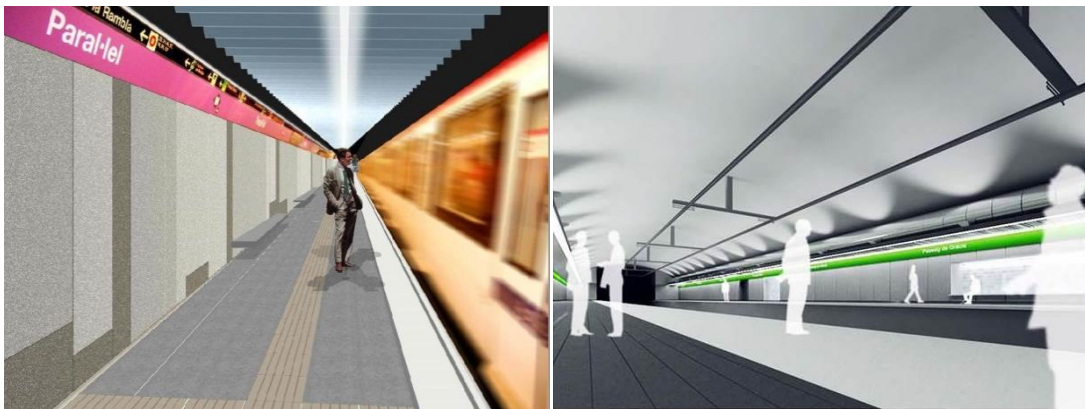
Dissenys proposats per a les naus d'andanes de Paral·lel L2, a l'esquerra, i Passeig de Gràcia L3

En la fase inicial de la reforma es treballarà al vestíbul del costat Ferrer Bassa, que quedarà tancat a partir del 21 de novembre durant 4 mesos, de manera que l'entrada i sortida de l'estació es farà a través de l'accés de Jaume Fabré o bé per l'ascensor. Més endavant la disponibilitat dels accessos s'invertirà. La durada de les obres en aquesta estació serà d'uns 10 mesos i el cost ascendeix a 1,52 milions d'euros.