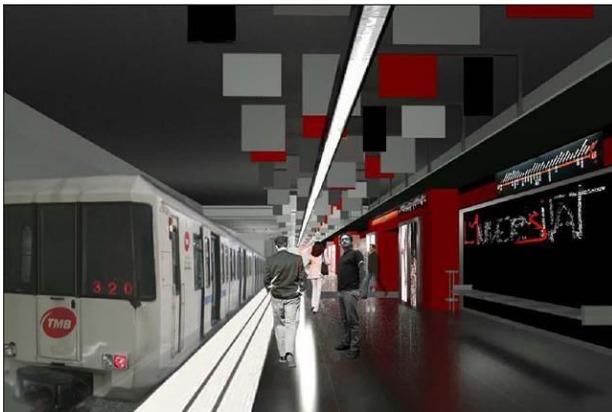
Combinació de colors per a l'andana d'Universitat L1

L'inici de les obres comporta el tancament del vestíbul secundari, el més pròxim a Consell de Cent, a partir del 21 de novembre, tot i que continuarà obert el passadís d'enllaç amb la línia 4. L'entrada des del carrer es farà pels dos accessos del costat Aragó i per l'ascensor. La durada de les actuacions s'estima en 9 mesos i s'hi invertiran 2,67 milions d'euros.