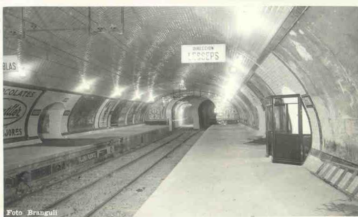
L'estació tal com era en els inicis del Gran Metro

Precisament, amb l'obra de rehabilitació en curs, iniciada el novembre passat, TMB recuperarà i posarà en relleu elements de l'arquitectura original, característica del Gran Metro, que les reformes posteriors havien ocultat. Així, la retirada del fals sostre i dels revestiments verticals de la nau d'andanes permetrà recuperar la perspectiva completa de la volta, revestida de rajola blanca bisellada, típica de molts metros construïts a principis del segle XX.