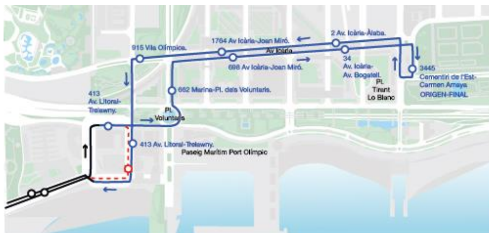
Traçat del nou recorregut de la línia 59 d'autobús de TMB.

El nou recorregut arrenca d'avinguda Litoral - Trelawny, continua pel carrer Marina, gira per l'avinguda Icària i arriba fins a la parada denominada Cementiri de l'Est - Carmen Amaya, final de trajecte. La tornada es fa per l'avinguda Icària i el carrer de Ramon Trias Fargas, al final del qual entronca amb el recorregut anterior pel passeig Marítim i la Barceloneta. Amb aquesta prolongació la línia 59 afegeix una connexió directa entre la Vila Olímpica i els eixos del passeig de Colom i la Rambla.