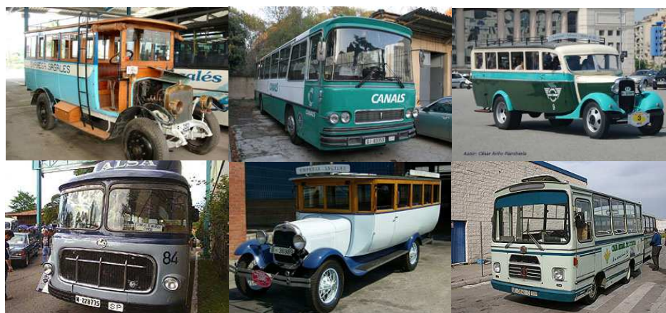
Diversos vehicles inscrits per participar en el ral·li.

També hi seran presents l'Hispano Suiza de 1909 i el Ford AA de 1929 de Sagalés; el Chevrolet Ayats de 1933, de Soler i Sauret; el Pegaso Z d'Alsa de 1959, o l'autocar Pegaso 5031 de 1969 i el microbús Sava de 1972, d'ARCA.