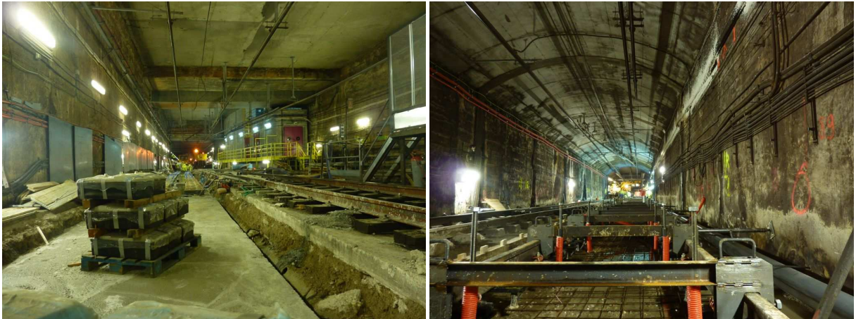
Treballs de renovació de la infraestructura al sector de Pep Ventura de la L2, l'agost del 2011

L'agressivitat d'aquestes filtracions provoca que el procés natural de desgast de la superestructura de via s'acceleri notablement. Per aquest motiu s'hi fa una vigilància especial de l'estat de la infraestructura i es planifiquen inversions de manera continuada, per garantir en tot moment les condicions per a la circulació segura dels trens.