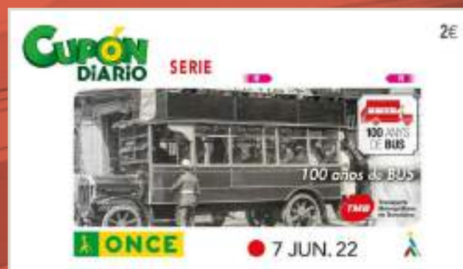
Imatge del cupó del Centenari de Bus de l'any 2022.

Amb motiu dels cent anys del metro de Barcelona, l'ONCE posarà a la venda un cupó commemoratiu. L'acte de presentació serà aquest 17 de desembre i s'aprofitarà per explicar els avenços que s'han realitzat en accessibilitat al metro de Barcelona.