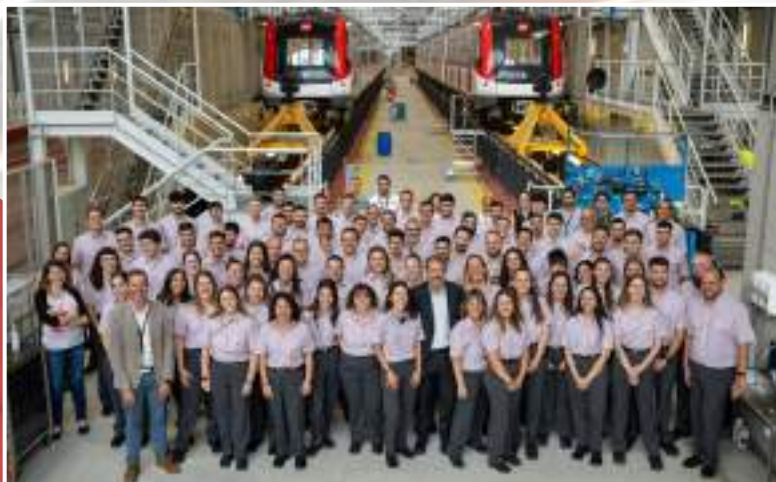
Foto dels darrers professionals que s'han incorporat a ZAL en el seu primer dia.

Més de 4000 professionals fan possible que el metro funcioni cada dia i el Centenari vol posar també de relleu la seva tasca. En el marc de la celebració d'aquests 100 anys, es presentaran novetats en un dels elements que més identifiquen els i les treballadores de TMB: la seva uniformitat. Aquest any de celebració explicarem com serà el nou vestuari dels nostres professionals tant a metro com a bus.