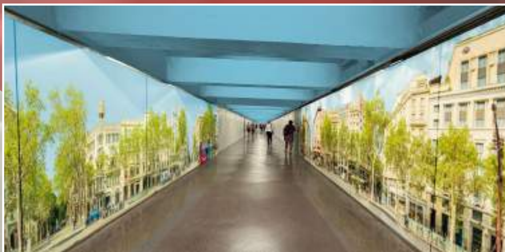
Foto del transbordament de metro de Passeig de Gràcia.

Des de TMB Innova, conjuntament amb la Fundació Barcelona Music Lab i la Fundació BIT Habitat, i amb motiu del centenari de metro, buscarem solucions innovadores que mitjançant la música, el disseny i l'art millorin l'experiència de viatge del transbordament de metro de Passeig de Gràcia (L3 i L4).