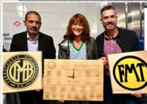
Comiat del darrer comboi de la sèrie 4000.

Algunes de les nostres estacions fantasma, alguns tallers de metro, llocs emblemàtics com la subcentral de Mercat Nou o l'espai on s'ubica l'escala de cargol d'Urquinaona, però també els simuladors on els i les nostres professionals es formen, seran alguns dels espais que tota la ciutadania podrà visitar.