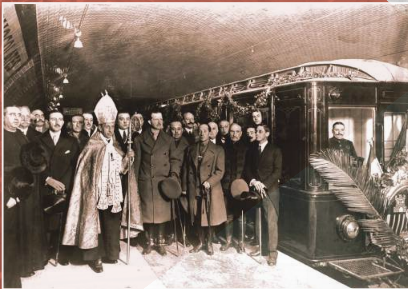
Foto de la inauguració del metro de Barcelona el 30 de desembre de 1924.

La xarxa de metro de Barcelona comença a prendre forma als anys vint del segle passat, quan es constitueix la societat Ferrocarril Metropolità de Barcelona, SA, tot i que s'estaven treballant diferents projectes des de principis de segle. Aquesta societat, coneguda popularment com «el Transversal», tenia l'objectiu de promoure una línia de ferrocarril subterrani entre Sants i Sant Martí. Posteriorment es va fundar una segona societat, el Gran Metropolità de Barcelona, SA Gran Metro, que pretenia construir una altra línia entre Colom i Gràcia.