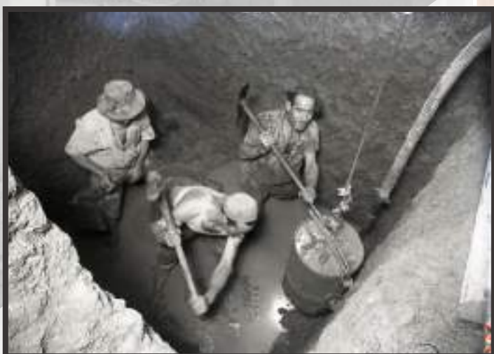
Foto dels treballs de construcció a la Marina l'any 1959.

Els acords de finançament permetran l'expansió de l'L3 amb noves estacions cap a Zona Universitària, malgrat estar encara la línia dividida en dos trams que no s'unificaran fins a mitjans del 1982. L'L4 es prolonga cap el mar i l'L5 s'amplia per comunicar Barcelona amb l'Hospitalet i Cornellà.