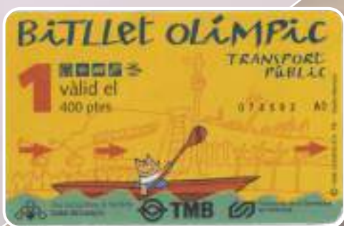
Bitllet Olímpic d'1 dia (any 1992)