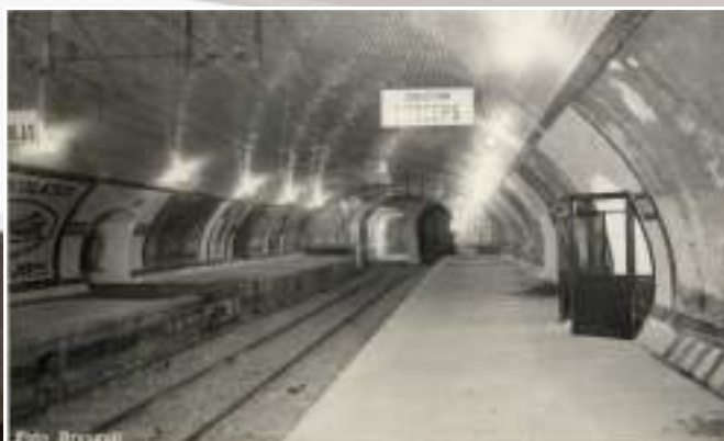
Foto de l'estació de Passeig de Gràcia l'any 1924.

L'escenari escollit per celebrar els 100 anys del metro el proper 30 de desembre serà l'estació de Passeig de Gràcia de l'L3, que va néixer amb el nom d' Aragón i que formava part del primer tram del Gran Metro.