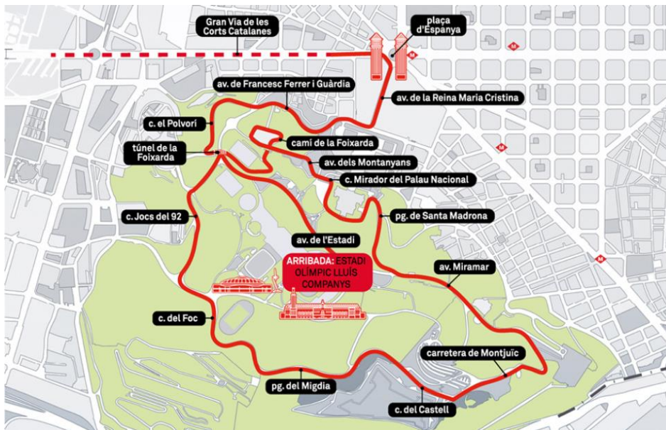
Recorregut de la segona etapa de La Vuelta