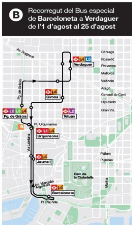
— Recorregut del Bus especial ○ Parada del Bus especial

Cal recordar que la mobilitat a les platges ja estava garantida amb l'L2 i ara, en aquesta segona fase, també amb l'entrada en funcionament de les estacions de Barceloneta i Ciutadella / Vila Olímpica.