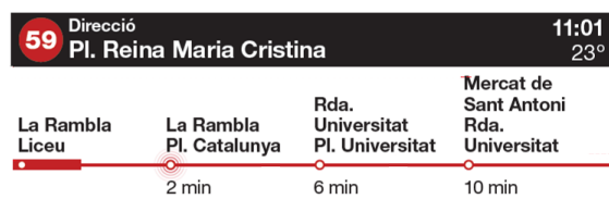
Previsió de temps d'arribada