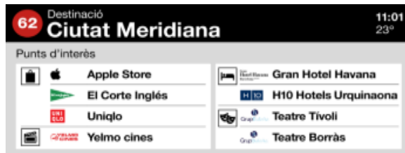
Contingut multimèdia estàtic