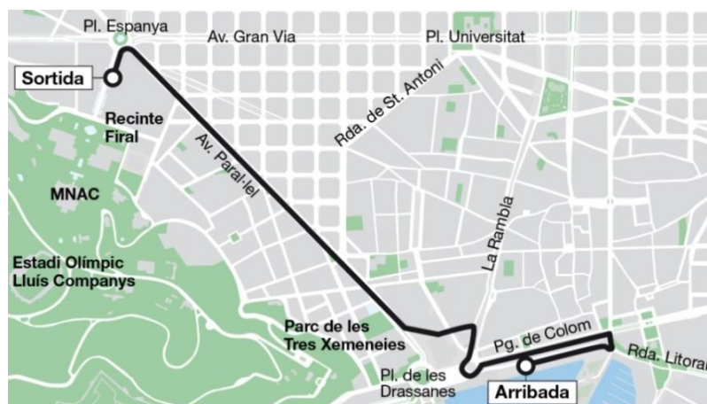
Recorregut del Pride Parade 2017

La desfilada provocarà afectacions en 29 línies de bus de TMB que fan part de l'itinerari per la zona afectada. Són les següents: D20, H12, H14, H16, V7, V11, V13, V15, V17, 13, 21, 22, 24, 27, 37, 39, 45, 46, 50, 51, 55, 59, 65, 79, 91, 109, 120 (no circularà a partir de les 17 h), 121 (no circularà a partir de les 17 h) i 150. A partir de les 8 del matí de dissabte les línies 13 i 150 no circularan per l'avinguda Maria Cristina.